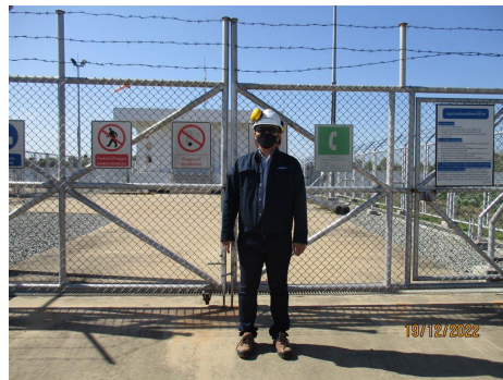
ภาพที่ 2-5 พนักงานสวมใส่อุปกรณ์คุ้มครองอันตรายส่วนบุคคล