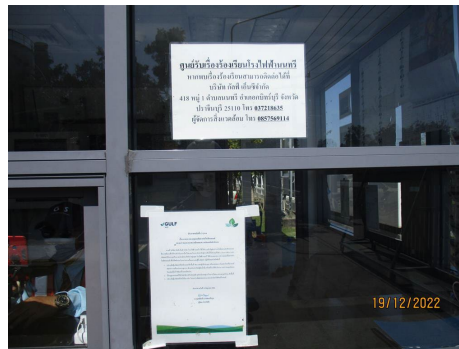
ภาพที่ 2-1 ศูนย์รับเรื่องร้องเรียน