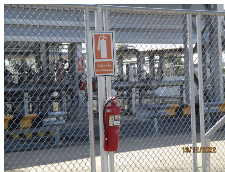
ภาพที่ 2-3 ถังดับเพลิงแบบเคมีผง และ Tag ตรวจสอบถังดับเพลิงแบบเคมีผง