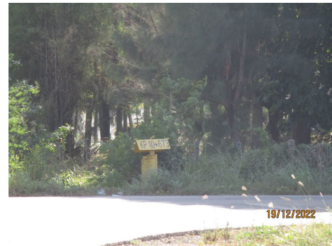
ภาพที่ 2-2 ป้ายแสดงตำแหน่งแนวท่อส่งก๊าซธรรมชาติ