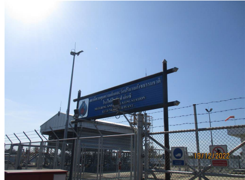
ภาพที่ 2-4 เจ้าหน้าที่รักษาความปลอดภัย บริเวณสถานีควบคุมความดันและวัดปริมาณก๊าซธรรมชาติ (MRS)